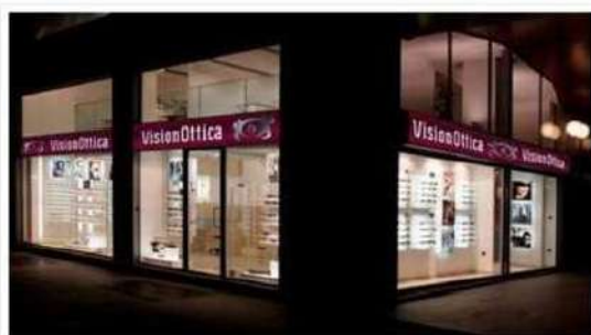
Uno store Vision ottica a Milano

Il colosso dell'occhialeria ha ceduto la catena Vistasì, che include il brand e i 99 negozi e 75 store Grandvision nel Bel Paese. Il deal fa seguito agli accordi stretti con la Commissione europea il 23 marzo 2021