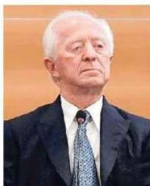
Leonardo Del Vecchio

EssilorLuxottica, GrandVision e Vision Group, una delle principali reti distributive per gli ottici in Italia e player retail con l'insegna VisionOttica, hanno annunciato il completamento dell'acquisizione da parte di Vision Group della catena VistaSi, che include il brand e tutti i 99 negozi, e di 75 negozi GrandVision in Italia. La cessione - si legge in una nota - fa seguito ai rimedi